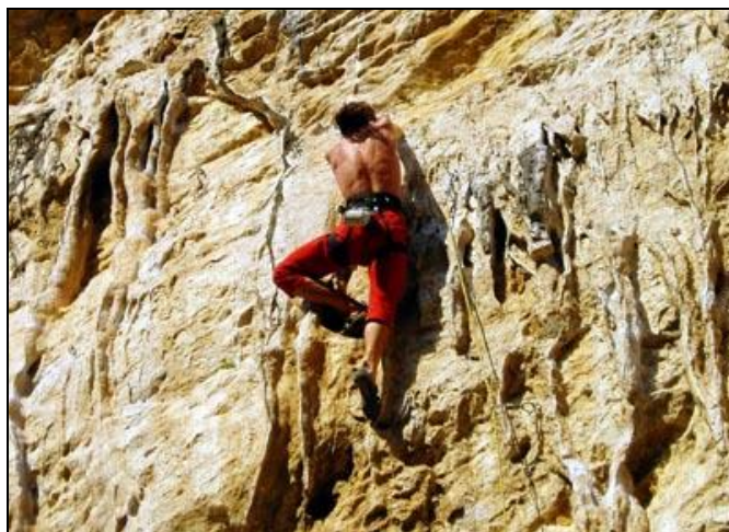
Španělsko, oblast Les Bruixes, Pavouk v cestě Avantmatch 7c.