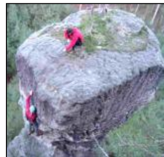
Ilustrační foto © 2005 Vlasta Domes

Máte-li v Dubských skalách nějaké prvovýstupy, urychleně je hlase Vrcholové komisi Dubské skály prostřednictvím protokolů o výstupu, internetových stránek LK Mšeno nebo alespoň přes redakci CAO News.